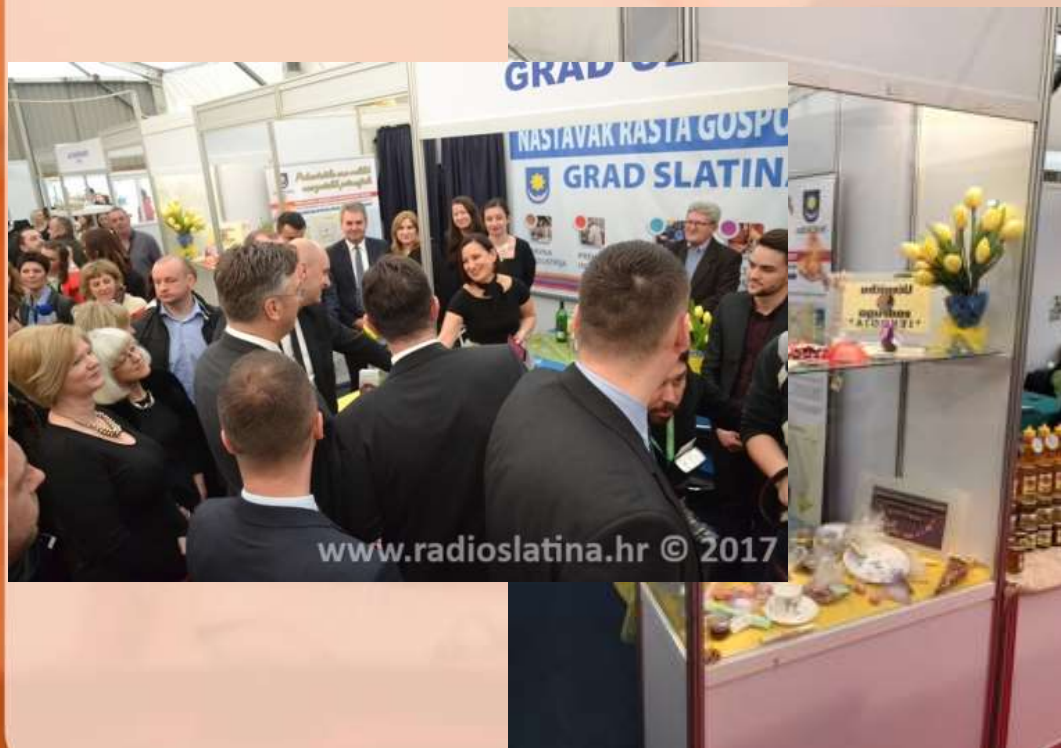
Cvjetne praline za Slatinski sajam cvijeća